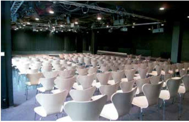
Das Kleine Theater | The Small Theatre | Blackbox Theatre